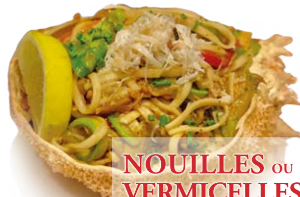
NOUILLES AU CRABE SAUMON