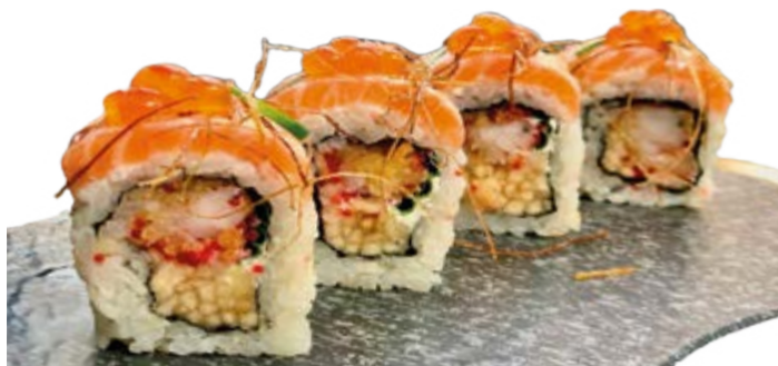
IKURA ROLL | 4 PIÈCES 75 DH

Saumon braisé, crème anguille, crevettes tempura, mangue, goma wakame