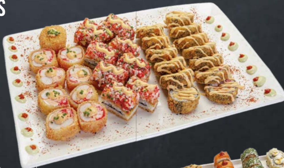
LE CRUNCHY BOX 33 PIÈCES | 269 DH