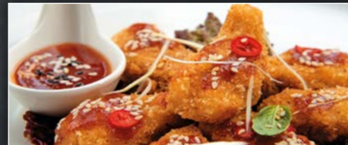
NUGGETS POULET | 5 PIÈCES 55 DH