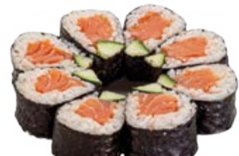
FULL MOON 8 PCES