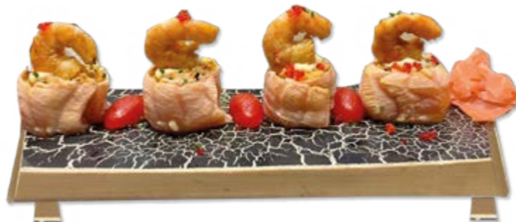
BONITO ROLL | 4 PIÈCES 75 DH

Saumon, crevettes tempura, ciboulette, cheese, chips