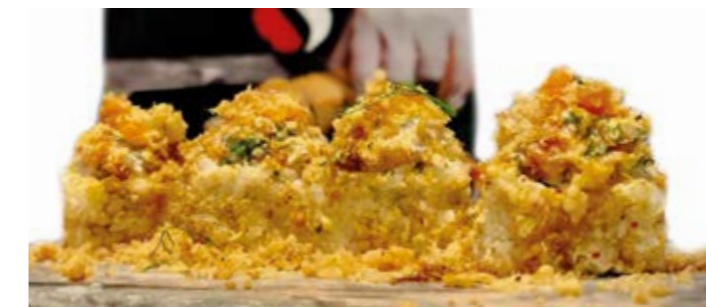
TANUKI ROLL | 4 PIÈCES 75 DH

Saumon pané, crevettes tempura, goma wakame, tobiko, mangue