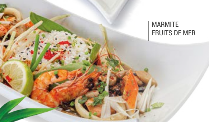
MARMITE FRUITS DE MER