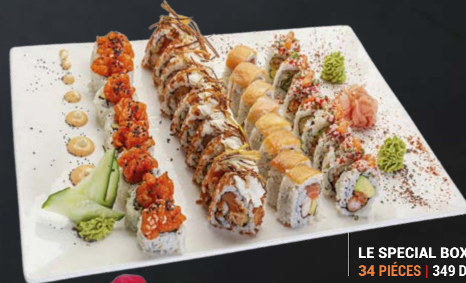
LE SPECIAL BOX 34 PIÈCES | 349 DH