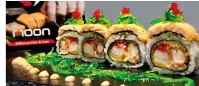
ROLL DU CHEF | 4 PIÈCES 78 DH

Saumon, surimi, eby, avocat, mangue, Cheese