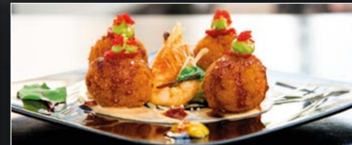
CROQUETTES CREVETTES & CALAMARS ÉPICÉS