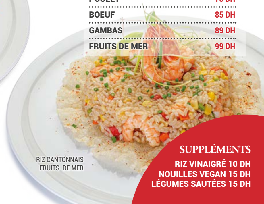
RIZ CANTONNAIS FRUITS DE MER