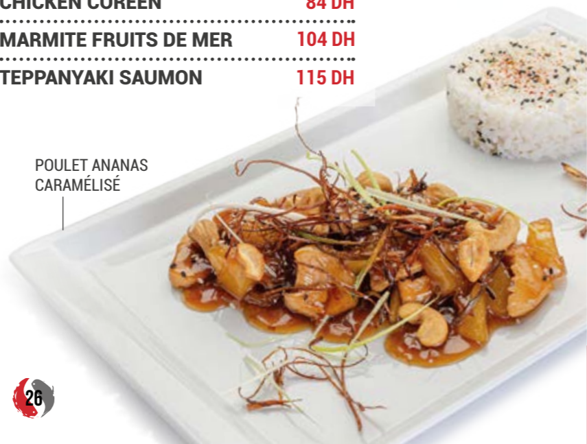
POULET ANANAS CARAMÉLISÉ