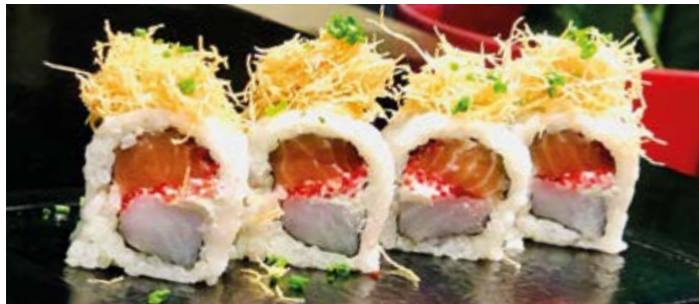
OSAKA ROLL | 4 PIÈCES 75 DH

Saumon, crevettes tempura, ciboulette, cheese, chips