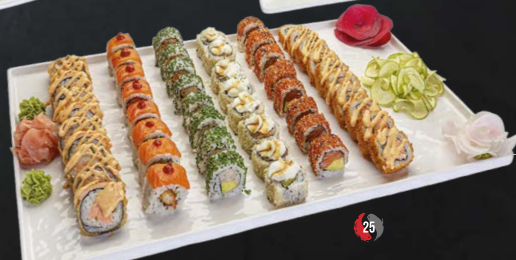
LE ROYAL BOX 52 PIÈCES | 479 DH