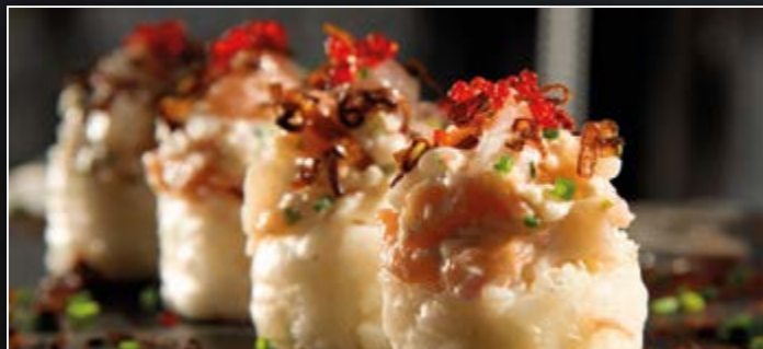
ROLL DE LUXE

Eby, cheese, cheddar, sauce mayo, tobiko