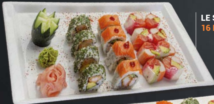
LE SMART BOX 16 PIÈCES | 165 DH