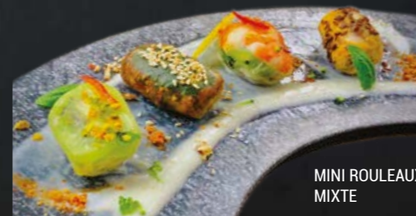
MINI ROULEAUX MIXTE