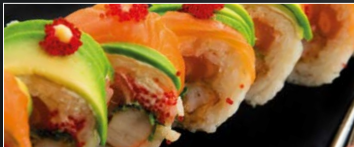
SPÉCIAL ROLL | 4 PIÈCES 55 DH