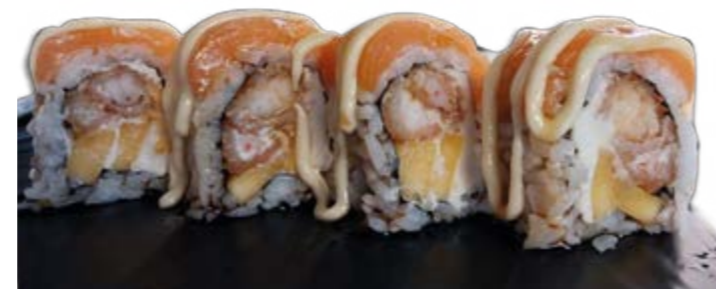
ASIAN ROLL | 4 PIÈCES 75 DH

Saumon, pomme, crevettes frites, ciboulette, cheese ikura