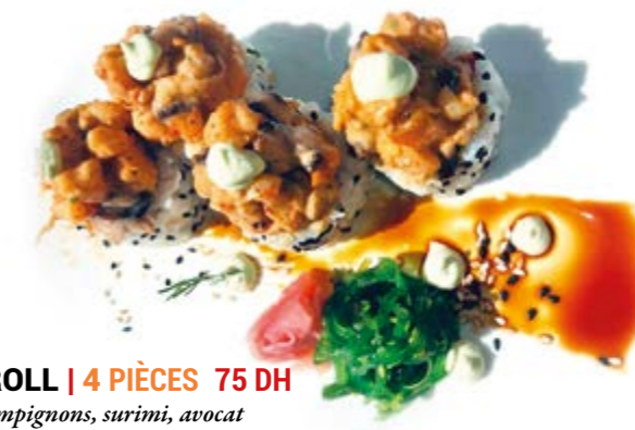
SHITAKI ROLL | 4 PIÈCES 75 DH

Saumon frit, Cheese, aneth, pomme tanuki