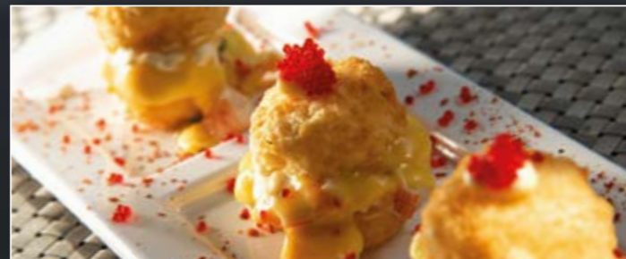
MINI BURGER CREVETTES | 3 PIÈCES 60 DH

Eby, cheese, cheddar, sauce mayo, tobiko