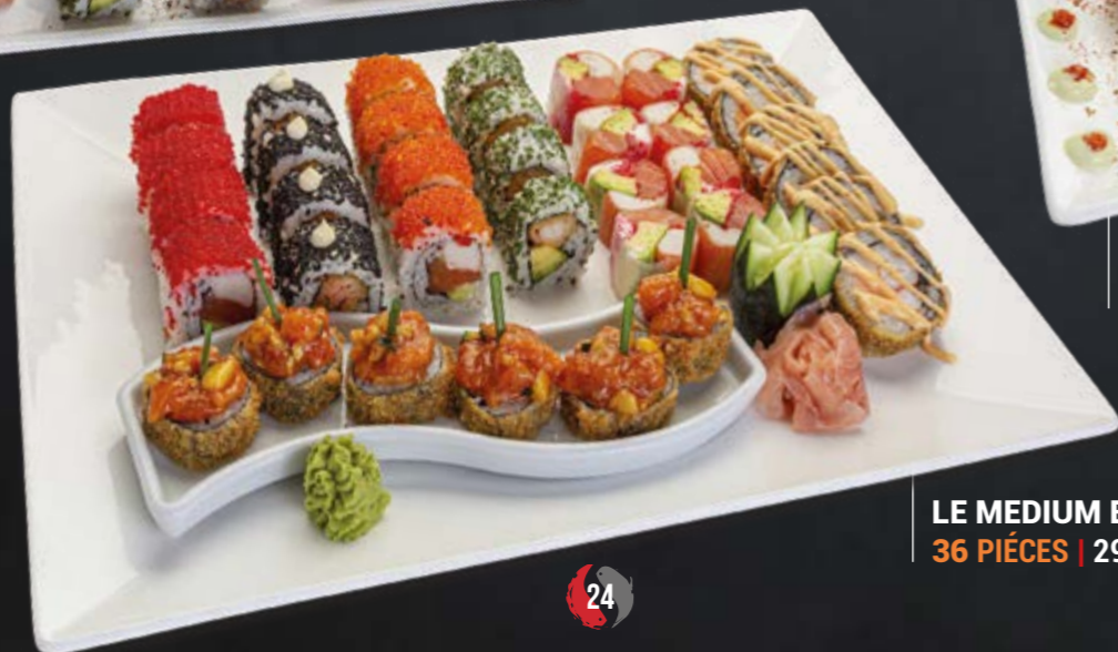
LE MEDIUM BOX 36 PIÈCES | 295 DH